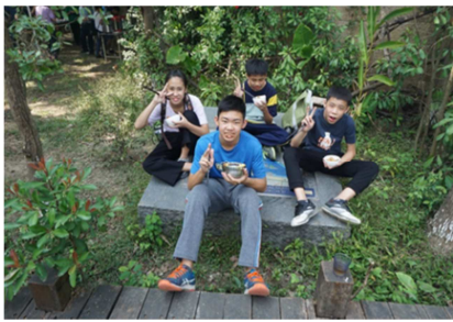
1081026【鳥松生態嘉年華】 享用美味午餐