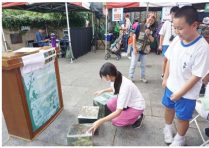
1081026【鳥松生態嘉年華】 鳥類拼圖遊戲