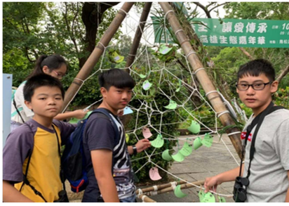
1081026【鳥松生態嘉年華】 參加祈願樹活動