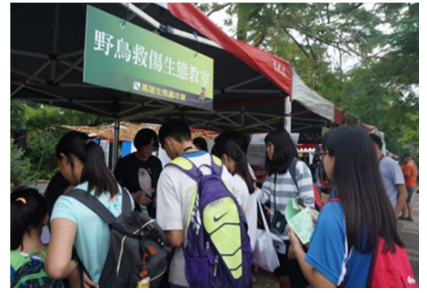
1081026【鳥松生態嘉年華】 野鳥救傷教室