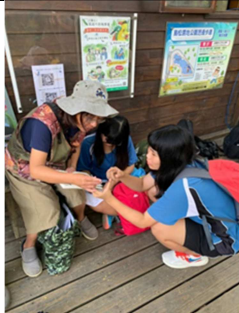
1081026【鳥松生態嘉年華】 橘子老師教學