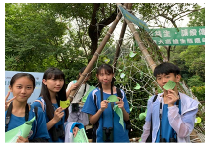
1081026【鳥松生態嘉年華】 參加祈願樹活動