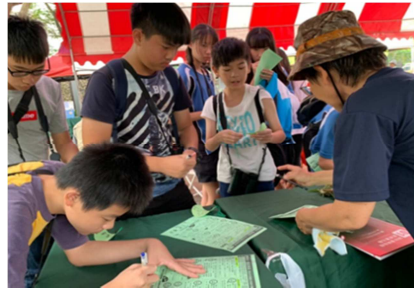
1081026【鳥松生態嘉年華】 生態知識作答