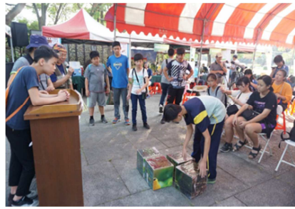
1081026【鳥松生態嘉年華】 鳥類拼圖遊戲