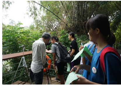
1081026【鳥松生態嘉年華】 輪流使用定點望遠鏡