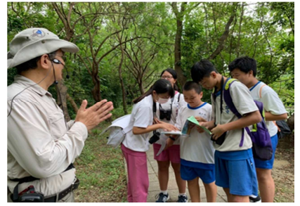
1081026【鳥松生態嘉年華】 國中生翻圖鑑找答案