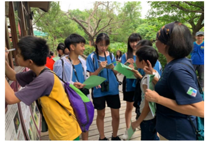
1081026【鳥松生態嘉年華】 學生認真填闖關問卷