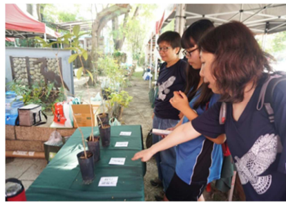
1081026【鳥松生態嘉年華】 小樹苗闖關獎品