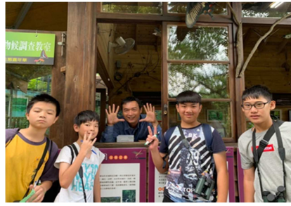
1081026【鳥松生態嘉年華】 國中生與講解員合影