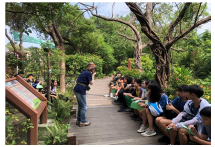
1081026【鳥松生態嘉年華】 第二組講師導覽