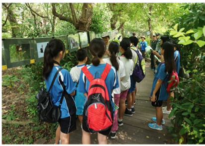
1081026【鳥松生態嘉年華】 鳥類攝影導覽