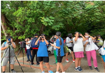
1081026【鳥松生態嘉年華】 旗美生和國中生賞鳥