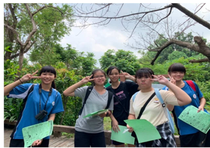
1081026【鳥松生態嘉年華】 學姊帶國中生闖關