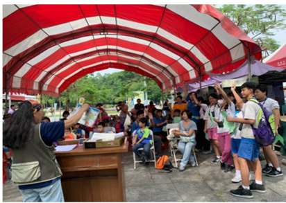
1081026【鳥松生態嘉年華】 國中生參加有獎徵答