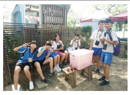
1081026【鳥松生態嘉年華】 和國中生共進午餐