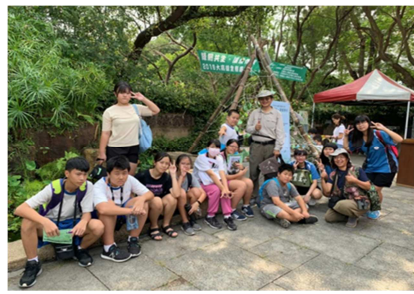
1081026【鳥松生態嘉年華】 第一組與講師合影