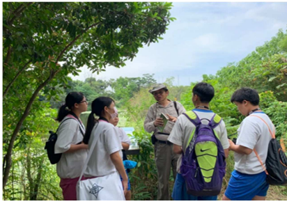
1081026【鳥松生態嘉年華】 溼地環境教學