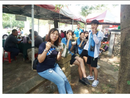
1081026【鳥松生態嘉年華】 師生共進午餐