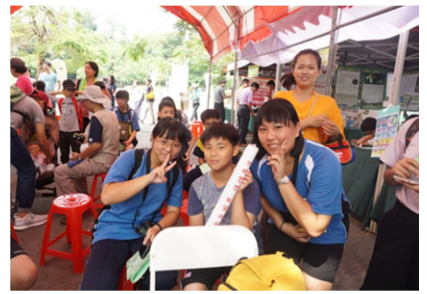
1081026【鳥松生態嘉年華】 得到獎品了