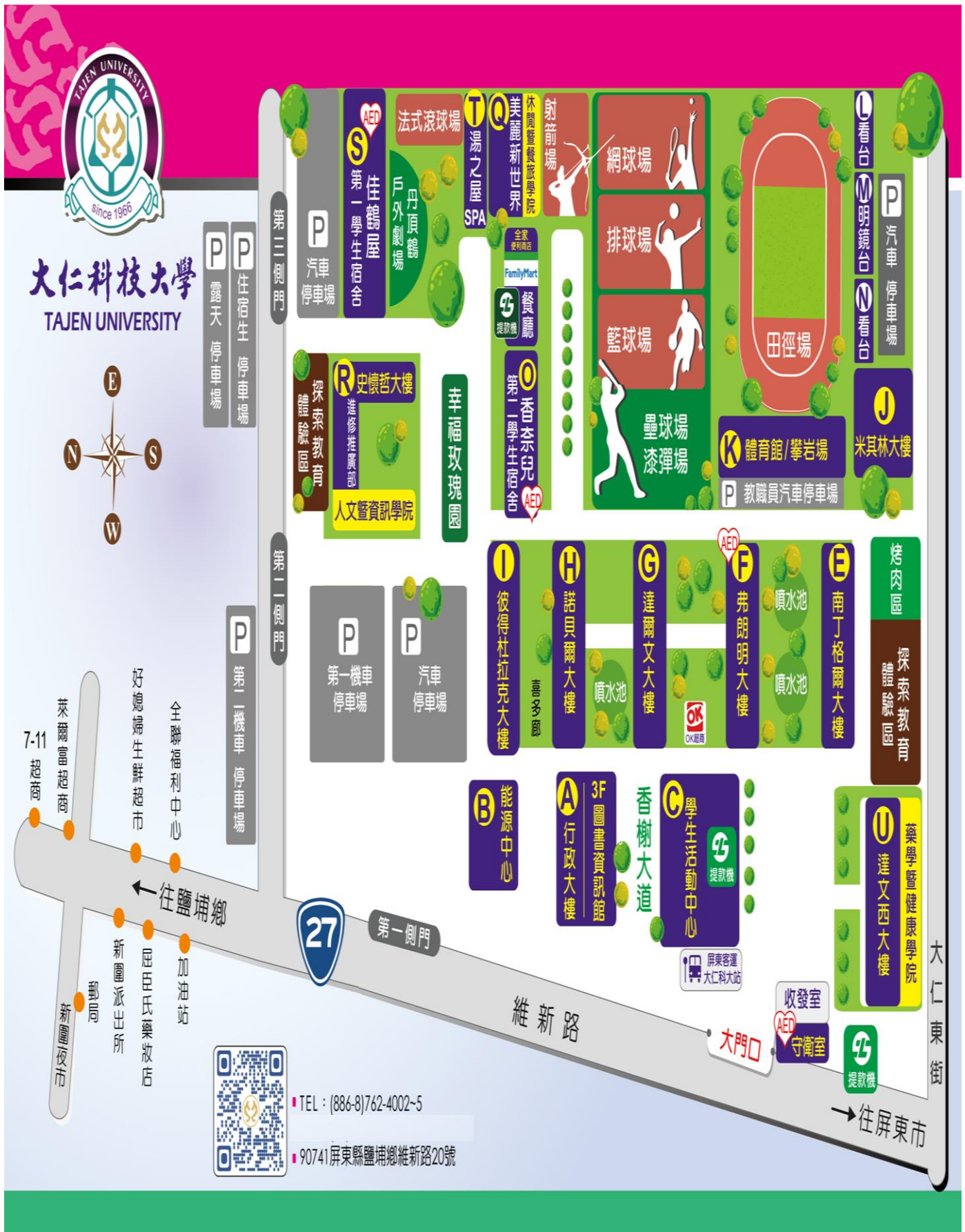
【附件十】大仁科技大學校區平面圖